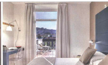
4. 50 Suite B&B , via Giambattista Pergolesi 1, tel. 081.18382313, 50suite.it . Sul lungomare Caracciolo, con dettagli e finiture di pregio. Doppia b&b da 70 euro. 5. Hotel Piazza Bellini , via S. Maria di Costantinopoli 101, tel. 081.451732, hotelpiazzebellini.com . In una dimora del '500, mix di arredi classici e contemporanei. Doppia b&b da 110 euro.